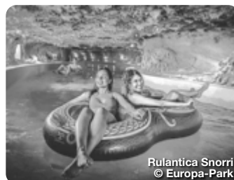
Rulantica Snorri