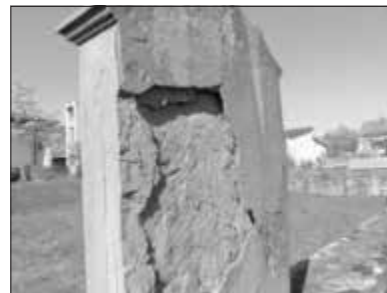
Kreuzwegstation vor der Restaurierung

Zwischenzeitlich hat ein Bürger aus Kronungen eigeninitiativ für die Restaurierung der Kreuzwegstationen gespendet, hierfür bedankt sich die Gemeinde Poppenhausen ebenso herzlich.