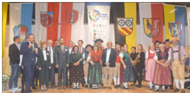
Ein gelungener Abend erinnerte an 20 Jahre erfolgreiche Zusammenarbeit in der ILE Oberes Werntal