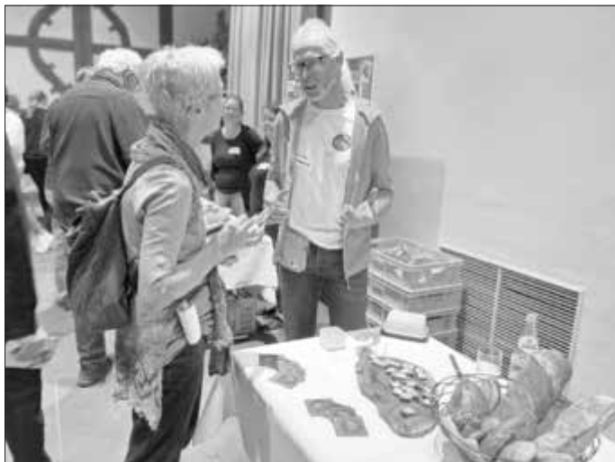
Die Vielfalt rund um Schweinfurt ist groß: Neben Ackerbauern, Mutterkuhhalterinnen, Gemüseproduzenten, Obstbäuerinnen, Brauern und Ziegenhalterinnen waren am Schweinfurter Wissensmarkt auch Bäcker vertreten