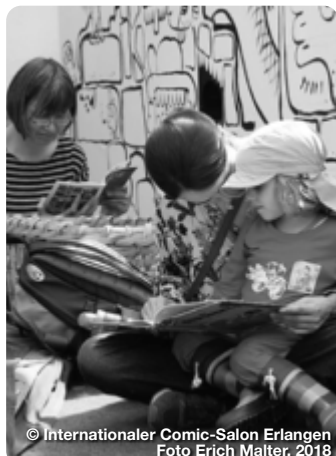
© Internationaler Comic-Salon Erlangen Foto Erich Maiter, 2018

Vom „Jupiter“ aus lässt sich ein besonders schöner Panoramablick über die Stadt Schweinfurt genießen: Das gleichnamige 50 Meter hohe Riesenrad ist einer der traditionellen Anziehungspunkte auf dem Schweinfurter Volksfest. Zahlreiche Buden und Stände verwöhnen die Gäste mit regionalen Spezialitäten und typischen Volksfest-Leckereien – vom Schäumele bis zur Zuckerwatte. Schweinfurt