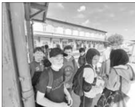
Foto und Text: Sandra Hinrichsen Am Donnerstag, den 2.6.2022, haben die beiden fünften Klassen der Mittelschule einen gemeinsamen Ausflug nach Bad Neustadt an der Saale gemacht und dort das BayernLab besucht. Neben einer Führung durch das BayernLab haben sich die Klassen zudem im Geocaching ausprobiert.

Leicht war das nicht – aber mit viel Motivation, Geduld und der ein oder anderen (minimalen) Hilfestellungen durch die Lehrkräfte gelang es letztendlich das Versteck zu orten.