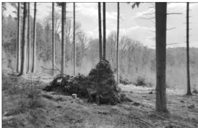
Kein Halten mehr für geschwächte Bäume nach Dürre und Sturm