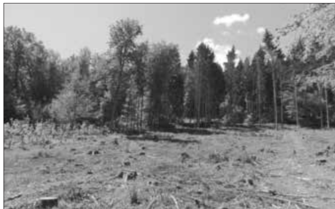
Kahlfelder nach Borkenkäferbefall, Dürre oder Sturm

Am Donnerstag, 25. April 2024 von 19.00 - 21.30 Uhr erhalten Sie im Crashkurs einen Überblick, worauf es bei der Wiederaufforstung von Schadflächen ankommt, welche Fehler Sie vermeiden sollten und wieso Geduld ein wesentlicher Erfolgsfaktor ist!