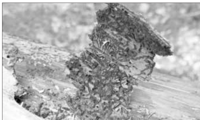
Gut unter der Rinde zu erkennen: Borkenkäferbefall an einer Fichte