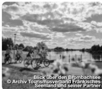
Blick über den Brombachsee

Badespaß und Erholung, Sportbegeisterung und Naturerlebnisse, echt fränkische Traditionen – das kontrastreiche Fränkische Seenland bringt all das zusammen. Sieben zugängliche Seen warten im Fränkischen Seenland auf Badenixen und Wassersportbegeisterte: Altmühlsee, Großer und Kleiner Brombachsee, Dennenloher See, Igelsbach-, Hahnenkamm- und Rothsee präsentieren sich als zugängliche Wasserflächen, die zum Baden, Boot fahren, Surfen und Segeln einladen. Auch an ihrem Ufer, wo wunderbare Sandstrände angelegt sind, ist für ein vielfältiges Freizeitangebot gesorgt. In der kontrastreichen Umgebung stößt man auf fränkische Fachwerkstädtchen, eingebettet in eine sanfte Hügellandschaft. TreffpunktDeutschland.de/fraenkisches-seenland