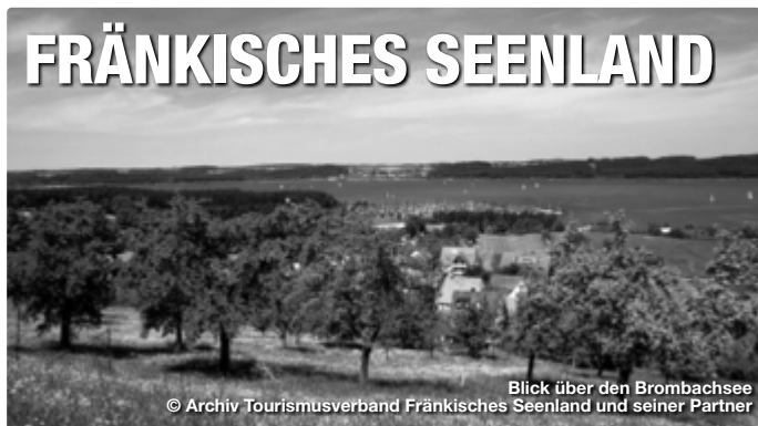
Blick über den Brombachsee