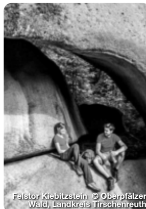
Felstor Klebitzstein

Hirschen“ in Rodenzenreuth bei Waldershof, ein Traditionsbetrieb mit erstklassigem Mix aus traditioneller bayerischer Küche und einzigartigen Spezialitäten, gefolgt von „PIER 28“ im ARIBO Hotel in Erbandorf, Hotel Restaurant Wiesend in Kulmain und Gasthof Pension Waldfrieden in Brand in der Oberpfalz. Die Bio-Genusswochen