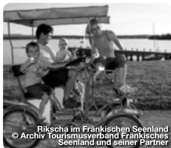
Rikscha im Fränkischen Seenland