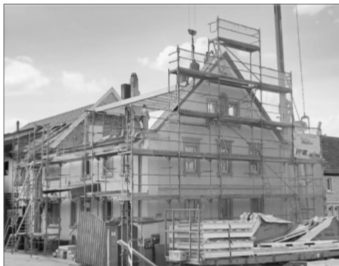
Ein neuer Dachstuhl kommt aufs Haus.