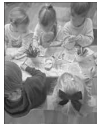
Aktives Lesen – vom Hören zum Tun