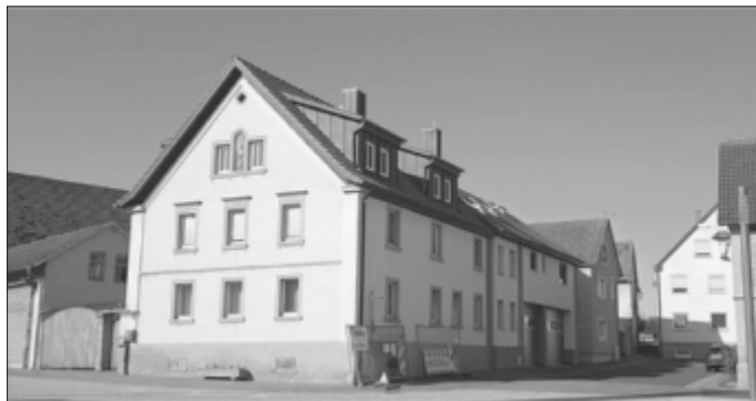
Neue Gauben sorgen für eine optimale Raumausnutzung.

Für alle Beteiligten eine gute Sache, die sowohl das Klima, als auch den Geldbeutel schont.