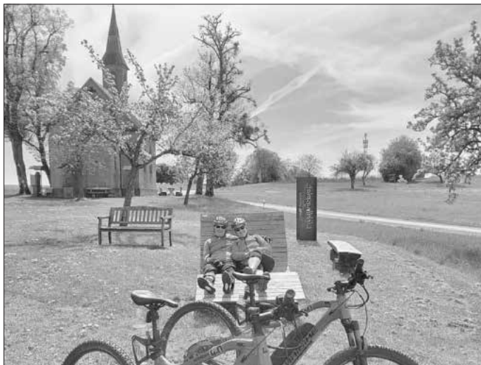
Entspannte Möglichkeiten zur Pause bot die Lieblingsplatz-Radtour 2026

Die Lieblingsplatz-Radtour hat einmal mehr gezeigt, wie viel Lebensqualität in gemeinsamen Erlebnissen und in unserer Heimat steckt. Informationen zum Angebot der „Lieblingsplätze“, zu Fuß oder mit dem Fahrrad erlebbar, gibt es unter www.oberes-werntal.de in der Rubrik Naherholung.