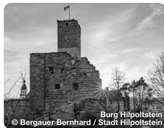
Burg Hilpoltstein