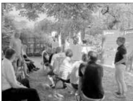
Bio-Landwirtschaft und Großküchen im Raum Schweinfurt im Austausch

„Endlich machen!“ - das war der breite Tenor der Vernetzungsveranstaltung Ende Juni auf dem ökologischen Landwirtschaftsbetrieb Schloss Gut Obbach. Gemeint ist der Einsatz regionaler biologischer erzeugter Lebensmittel in den Großküchen.