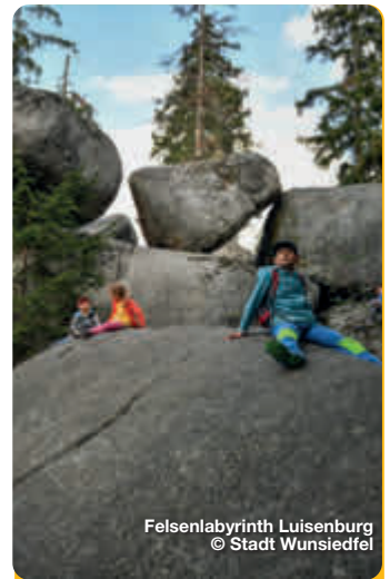
Felsenlabyrinth Luisenburg

Angezogen vom prächtigen Opernhaus der Markgräfin Wilhelmine kam Richard Wagner 1871 erstmals nach Bayreuth. Die Stadt gefiel ihm so gut, dass er blieb und in der Stadt sein Festspielhaus errichtete. 1876 fand im Festspielhaus auf dem Grünen Hügel nach zweijähriger Bauphase die Uraufführung seines „Ring des Nibelungen statt“. Bis heute sind die Bayreuther Festspiele das bedeutendste Opernfestival Deutschlands und das Festspielhaus zählt zu den besten und größten Opernbühnen der Welt. Festspielhügel 1-2, Bayreuth