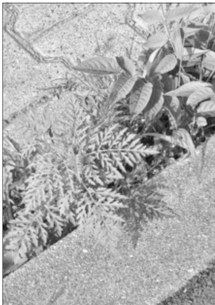
Ähnlich junger Tagetes-Pflanzen

Typische Fundorte für Ambrosia-Pflanzen sind Vogel-Futter-Stellen, Brachen und Wegränder.