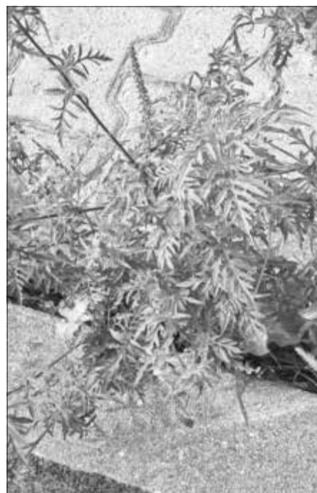
So sehen Ambrosia-Pflanzen jetzt (im Juli) aus: mit Traubenblüten-Stand