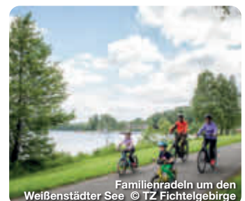
Familienradeln um den Weißenstädter See