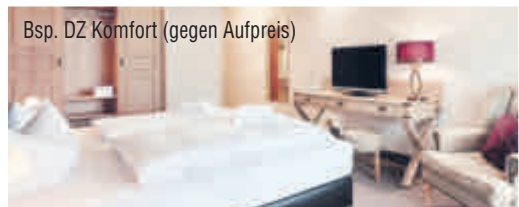
Bsp. DZ Komfort (gegen Aufpreis)

Ihr Hotel begrüßt Sie am Rande des Berges Hoher Bogen, idyllisch am Waldrand. Es besteht aus mehreren Gebäuden und verfügt u. a. über ein Restaurant mit drei Speiseräumen, Lobby-Bar mit Kamin, Dachterrasse und große Bade- und Wellnesslandschaft mit Hallenbad, Außenpool, Saunen u. v. m.