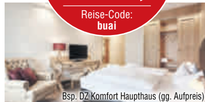
Bsp. DZ Komfort Haupthaus (gg. Aufpreis)