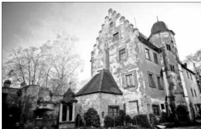
Das Schloss Schwebheim ist eines von mehreren Denkmälern im Landkreis Schweinfurt, das am Tag des offenen Denkmals am 8. September besichtigt werden kann.

Alle Bürgerinnen und Bürger sind herzlich dazu eingeladen, diese kulturellen Schätze unseres Landkreises kennenzulernen.