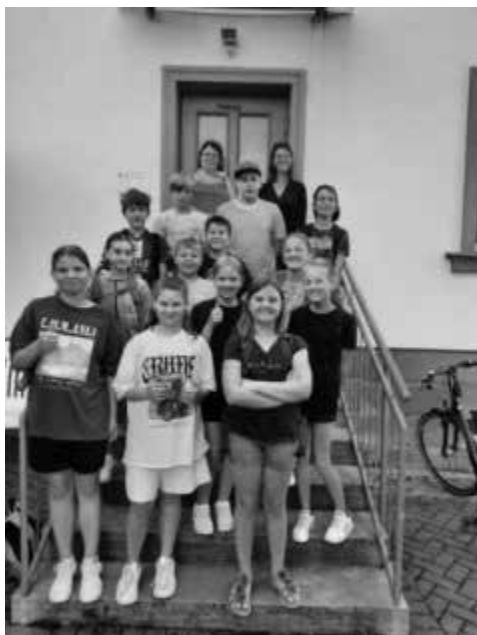
Klasse 5 der Oerlenbacher Mittelschule