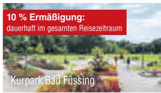
Kurpark Bad Füssing