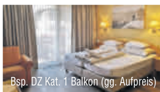
Bsp. DZ Kat. 1 Balkon (gg. Aufpreis)