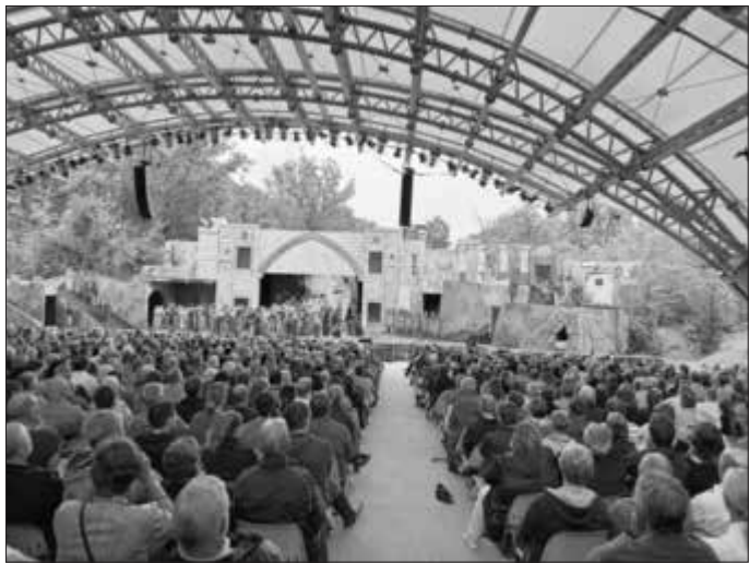
Insgesamt rund 1700 Gäste besuchten die Ehrenamtsveranstaltung des Landkreises Schweinfurt in Sömmersdorf