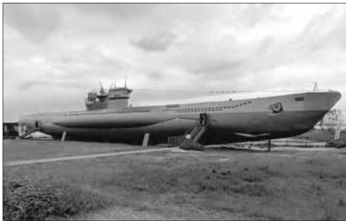
Das U-Boot „U-995“ vor dem Marinedenkmal in Laboe