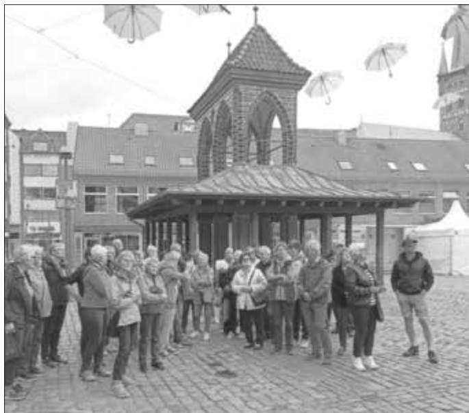
Beim Stadtrundgang in Lübeck