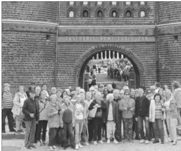
Gruppenfoto vor dem Holstentor in Lübeck

Fehmarn, Lübeck, Kiel - Hin und wieder zurück