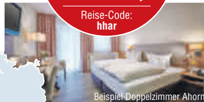
Beispiel Doppelzimmer Ahorn