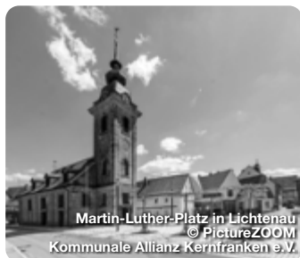
Martin-Luther-Platz in Lichtenau

In Kernfranken ist der Genuss zu Hause. Die Region im Herzen Mittelfrankens ist nicht nur reich an kulturellen Sehenswürdigkeiten und abwechslungsreichen Freizeitangeboten. Hier erleben Sie echte Gastlichkeit und typisch fränkische Küche, die zu jeder Jahreszeit ganz besondere Schmankerl zu bieten hat. Von knusprigem Karpfen über deftige Brotzeiten bis hin zu köstlichen Spargelgerichten reichen die fränkischen Gaumenfreuden. Dazu passt immer ein gut gekühltes Bier. Besuchen Sie die Städte und Gemeinden Kernfrankens und lassen Sie sich von ihrer kulinarischen Vielfalt verwöhnen! Übrigens: Für einen längeren Aufenthalt bieten Hotels, Gaststätten und Ferienwohnungen immer komfortable Unterkünfte. TreffpunktDeutschland.de/kernfranken