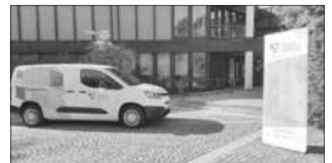
Das Info-Mobil der Initiative digital-vereint.