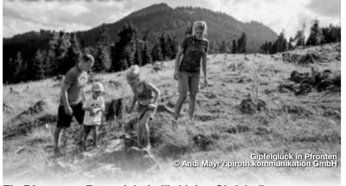
Gipfelglück in Pfronten