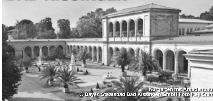
Kurgarten mit Arkadenbau

Im Herzen Deutschlands steht im Bayerischen Staatsbad Bad Kissingen der moderne Mensch mit seinem Bedürfnis nach Erholung und Entspannung im Mittelpunkt. „Zeit“ ist im bekanntesten Kurort Deutschlands zentrales Leitmotiv und überall zu spüren – in der eindrucksvollen Geschichte und Architektur, in den Gärten und Grünanlagen im Wechsel der Jahreszeiten, im ewigen Sprudeln der heilenden Quellen sowie den abwechslungsreichen Festen und Veranstaltungen. In Bad Kissingen verbindet sich altbewährte Bäderkultur mit Wellnessprogrammen auf höchstem Niveau, historisches Ambiente trifft auf zeitgemäße Kultur- und Tourismusangebote.