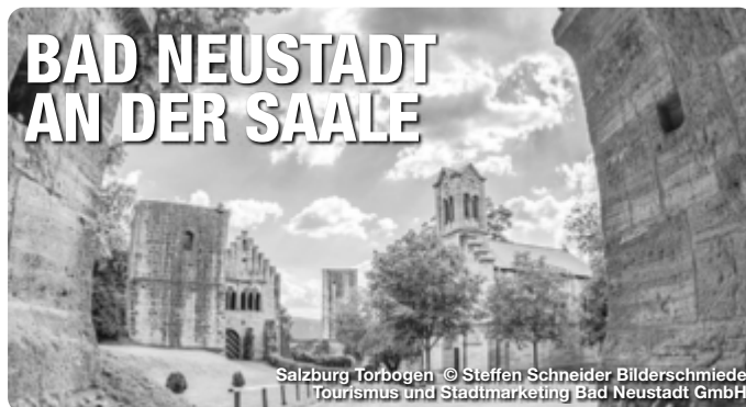
Salzburg Torbogen

Bad Neustadt a. d. Saale liegt in der Mitte Deutschlands, am Fuße der Bayerischen Rhön. Durch seine zentrale Lage ist der Ort gut zu erreichen und bietet viele Ausflugsmöglichkeiten in die vielseitige Region. Drei verschiedenen, reizvolle Trails des DSV Nordic aktiv Walking Zentrums laden Walkingbegeisterte und Wanderer zum Entdecken ein. Die über 400 km markierten Wander- und Radwege auf teils stillgelegten Bahntrassen führen zu herrlichen Aussichtspunkten und beliebten Ausflugszielen in der Bayerischen Rhön. Das Wellness- und Erlebnisbad Triamare vereint Sport, Spaß und Wellness miteinander