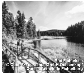
Rad Fichtelsee © Cube © Tourismus GmbH Ochsenkopf Quelle: Gemeinde Fichtelberg

großen Nachbarn der Metropolregion verstecken. Die hübsche historische Altstadt mit vielfältigen Shopping-Möglichkeiten, das Neue Schloss mit dem Hofgarten und, etwas außerhalb, die Eremitage sind Zeugnisse einer schillernden Vergangenheit. TreffpunktDeutschland.de/bayreuth