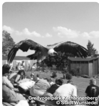
Greifvogelpark Katharinenberg