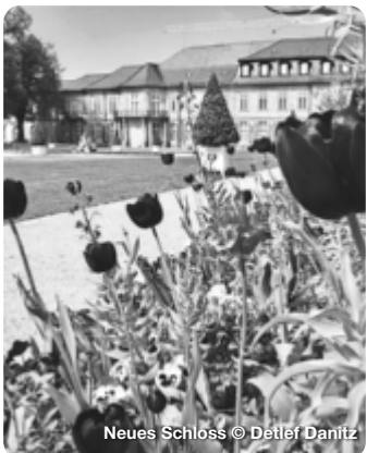
Neues Schloss