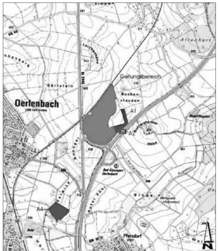
Auszug Bayernatlas, unmaßstäblich

In der Sitzung vom 28.06.2023 hat der Zweckverband Gewerbepark A 71 die Entwurfsunterlagen der 3. Änderung und Erweiterung des Bebauungsplans für den Gewerbepark A 71 gebilligt.