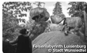
Felsenlabyrinth Luisenburg