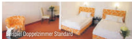
Beispiel Doppelzimmer Standard

Ihr Hotel ist knapp 3 km vom Ortskern entfernt. Es besteht aus zwei Gebäuden und bietet u. a. ein Restaurant, Terrasse und Aufzug. Die Poseidon-Therme (ca. 1.600 m 2 ) mit Außenpool, Thermalbecken, Whirlpool u. v. m. erreichen Sie bequem über einen Bademantelgang.