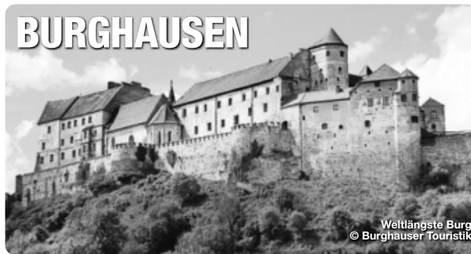
Weltlängste Burg

Reiseführer. Reisemagazine. Freizeittipps.