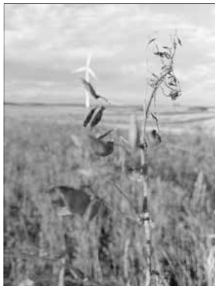
Linsen im Oberen Werntal