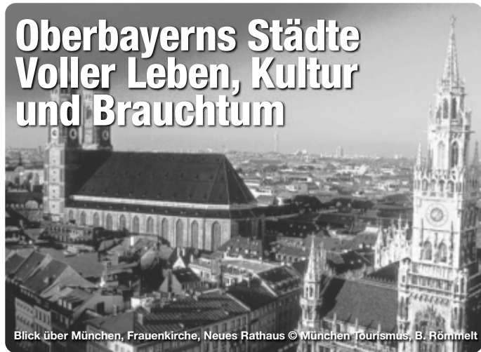
Blick über München, Frauenkirche, Neues Rathaus

Nirgends zeigt sich Oberbayern so vielfältig wie in seinen kleinen und großen Städten. Hier trifft Tradition auf Moderne, urige Stammwirtschaft auf experimentelle Sterneküche, alte Bräuche auf junge Events. Historische Sehenswürdigkeiten erzählen Geschichten längst vergangener Zeiten, während Museen mit weltbekanntesten Kunstwerken begeistern und diverse Veranstaltungen Menschen aus aller Welt zusammenbringen. Ebenso überzeugen die oberbayerischen Städte allesamt durch ihre Nähe zur Natur. Die Vielzahl an Seen und Flüssen, Moorlandschaften und Wiesen, imposanten Bergen und weitläufigen Wäldern schenken die Möglichkeit, dem städtischen Trubel für einen Moment zu entfliehen, Kraft zu tanken und die Region aktiv auf dem Radl, im Wasser oder zu Fuß zu erleben.