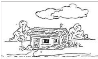
So sehen Käufer Ihr Haus

Gerade bei langjährigem Familienbesitz spielt die persönliche Bindung eine große Rolle. Für den Verkauf ist jedoch ausschließlich der objektiv ermittelte Verkehrswert entscheidend. Dabei ist es die Aufgabe des Gutachters eine möglichst neutrale und sachliche Einschätzung vorzunehmen. Wichtig ist: Die Bezeichnung „Gutachter“ ist geschützt und steht für qualifizierte Fachleute. Das entsprechende Bewertungsverfahren liefert eine fundierte Grundlage für die Ermittlung realer Gebäudewerte.