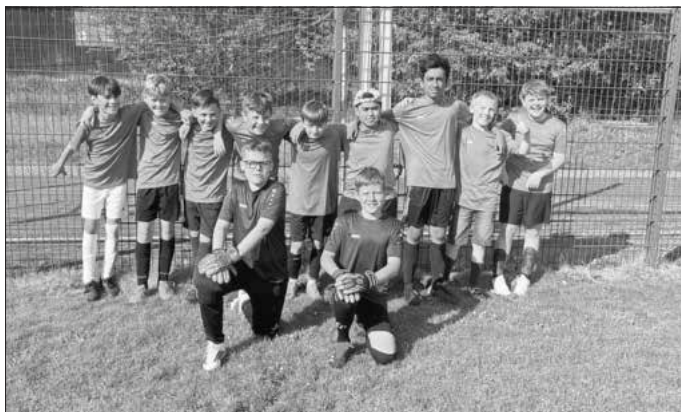
Das Team der Grundschule Poppenhausen